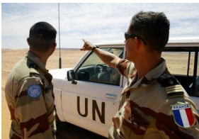
¿Cascos azules en el Sahara Occidental, para que?

La MINURSO esta en el Sahara Occidental desde el 6 de septiembre. Llego para organizar el referéndum de autodeterminación que nunca se celebró pero la Misión sigue allí sin dar ni siquiera un paso hacia la vigilancia de derechos humanos. A la lectura del ultimo informe de Ban Ki Moon (S/2010/175), Naciones Uni-